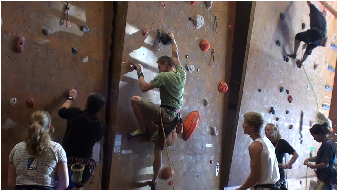
Billede fra klatring på en almindelig klubaften

Medlemstallet i NJK har været støt stigende gennem årene. Sammenlignes klubbens medlemstal med klatreklubber i Odense og Århus, ses det at medlemstallet i NJK er langt mindre. Der er registreret omkring 700 medlemmer i Århus, og 540 i Odense. Sammenlignes medlemsudviklingen for de tre byer, Aalborg, Århus og Odense, over de seneste år, bliver denne forskel meget tydelig, som det fremgår af Figur 2.