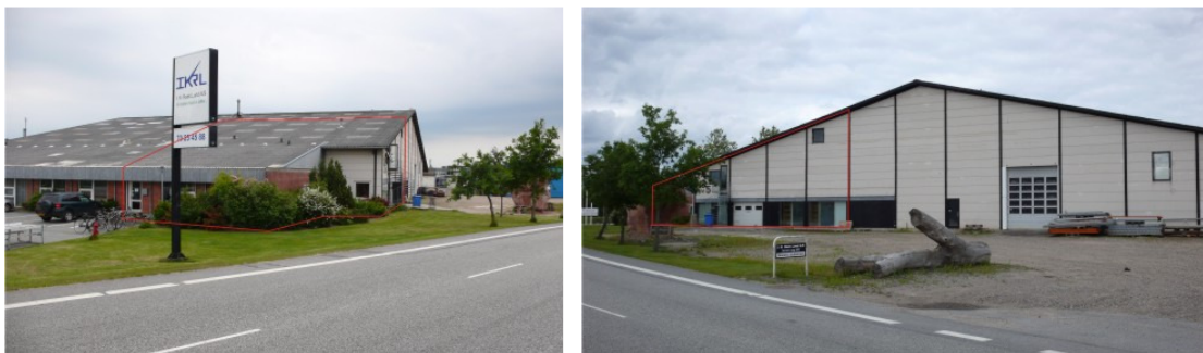
Figur 1: Foto af eksisterende lokaleforhold (markeret med rødt) for NJK. Billederne er af henholdsvis vestvendt- og sydvendt facade.