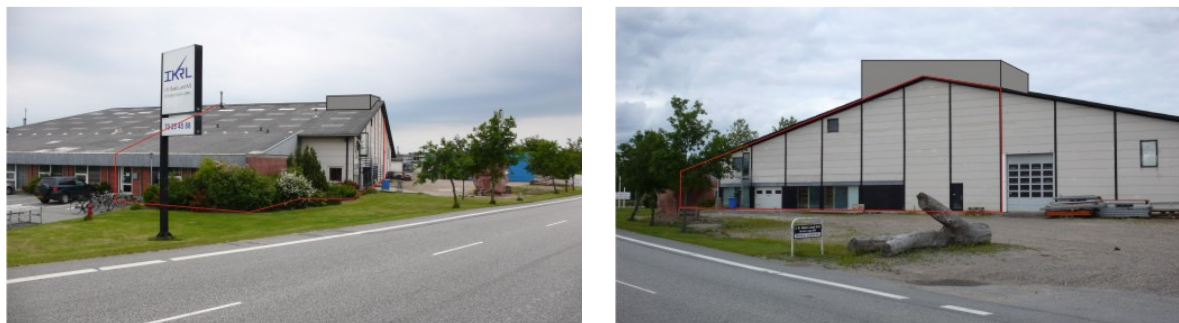
Figur 3: Foto af fremtidige lokaleforhold (markeret med rødt) for NJK. Billederne er af henholdsvis vestvendt- og sydvendt facade.

For at opkvalificere klubbens klatrefaciliteter til konkurrencevægsstandard, hvilket er en af de mere væsentlige bevæggrunde bag udvidelsesplanerne, skal der bygges et mindre tårn ovenpå den eksisterende bygning, som illustreret på Figur 3.